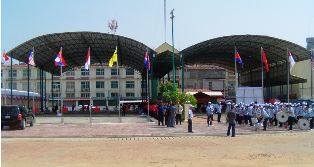
Fédération of cambodia pétanque and Petanque field in Olympic stadium in Phnom Penh